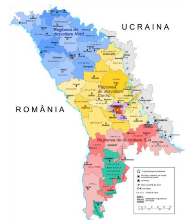
Figura 1. Harta regiunilor de dezvoltare